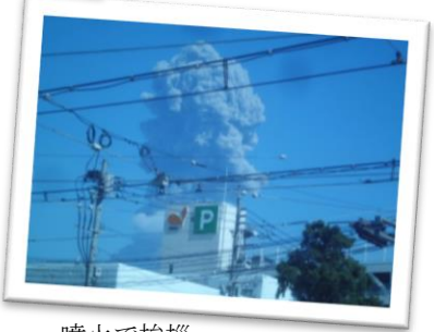
噴火で挨拶 「またおじゃったもんせ」