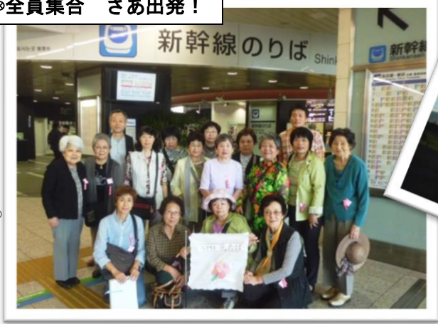
◎全員集合 さあ出発！