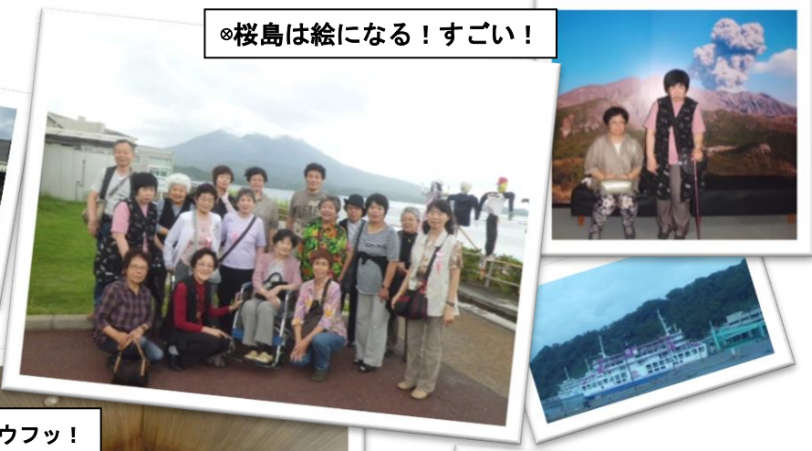
◎桜島は絵になる！すごい！